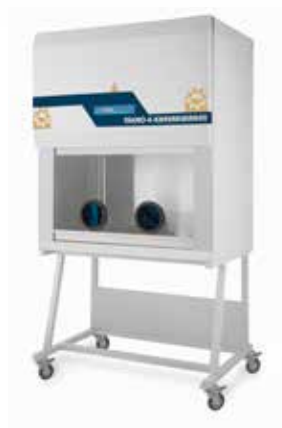
هود شیمی درمانی