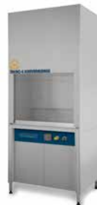
فیوم هود شیمیایی