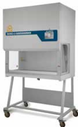
هود لامین ایر فلو