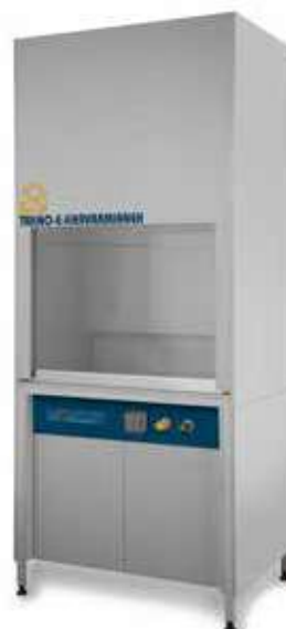
فیوم هود شیمیایی ■ کد TKF100 Chemistry Hood