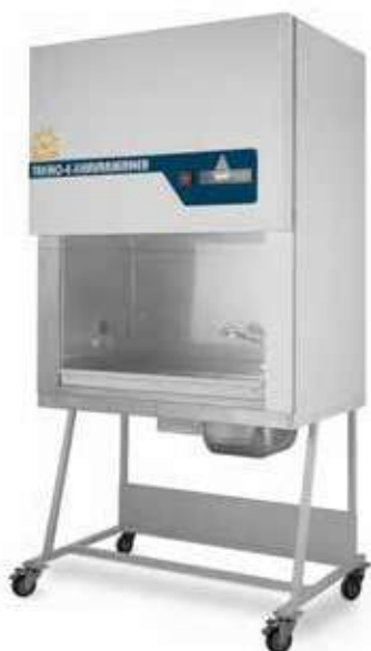
هود پاتولوژی ■ کد TKPA 120 Pathology Hood