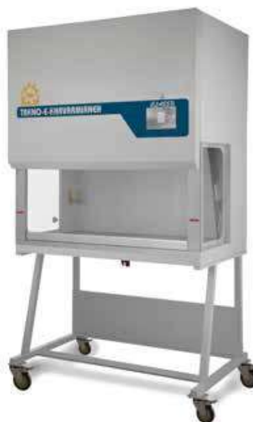
هود لامین ایر فلو ■ کد TKL130 Laminar Hood