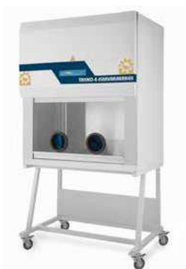
هود شیمی درمانی ■ کد TKCH 120 Chemotherapy Hood