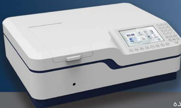
Double Beam UV-Visible spectrophotometer With Xenon Lamp , PMT Detector

PMT Detector دارای توانایی دریافت سیگنال از ضعیفترین میزان نور بوده و پوشش دهنده رنج Photometric range: -4~ 4A می باشد.