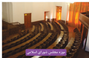
موزه مجلس شورای اسلامی