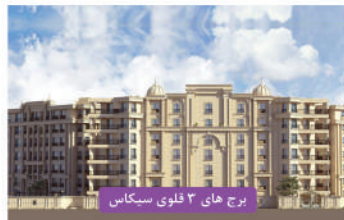
برج های ۳ قلوبی سیکاس