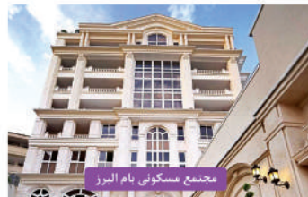
مجتمع مسکونی بام البرز