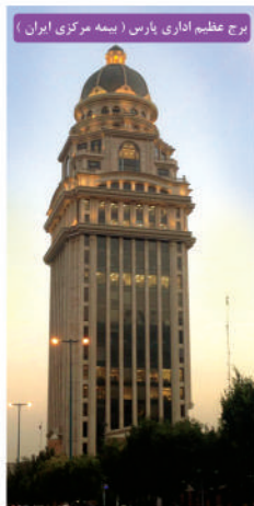
برج عظیم اداری پارس ( بیمه مرکزی ایران )