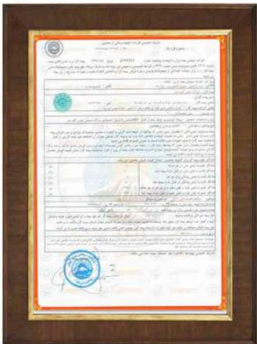
بیمه نامه تضمین کیفیت ، مسئولیت جانی و مالی از شرکت سهامی بیمه ایران