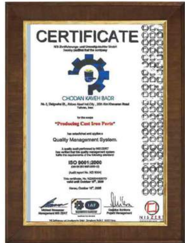
گواهینامه ایزو ۲۰۰۰ - ۹۰۰۱