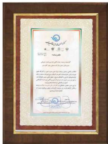
تقدیرنامه کنفرانس ملی مدیریت سیلاب