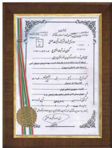
گواهینامه ثبت اختراع درجه های کوپلمری