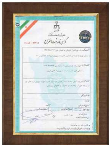
گواهینامه ثبت اختراع درجه های کوپلمری