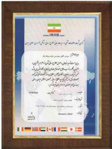
گواهینامه ثبت اطلاعات شغلی در سایت مشاغل جمهوری اسلامی ایران