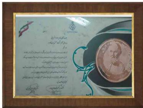
دریافت جایزه ملی بقراط در گروه آب و فاضلاب در سال ۱۳۹۱