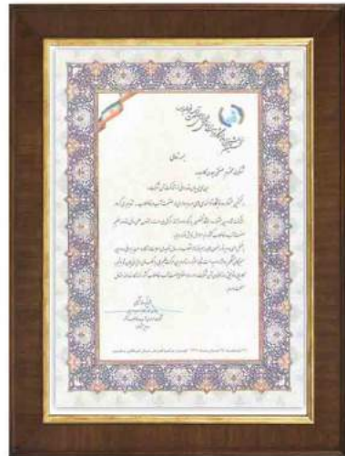
تقدیرنامه شرکت در نخستین نمایشگاه توانمندی های بهره برداری در صنعت آب و فاضلاب