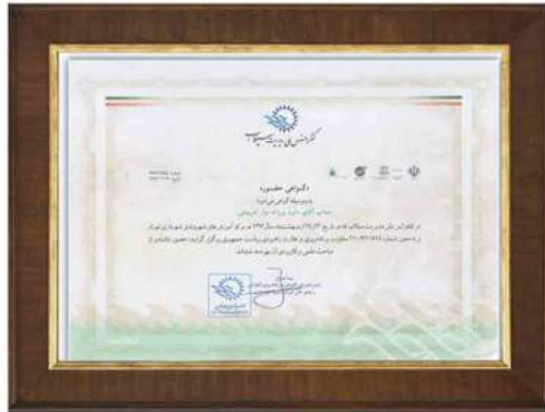
گواهی حضور در کنفرانس ملی مدیریت سیلاب در سال ۱۳۹۲