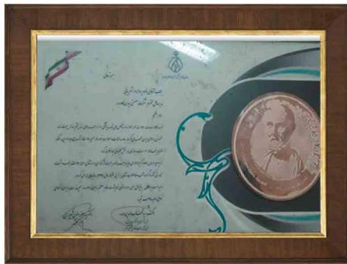
دریافت جایزه ملی بقراط در گروه آب و فاضلاب در سال ۱۳۹۱