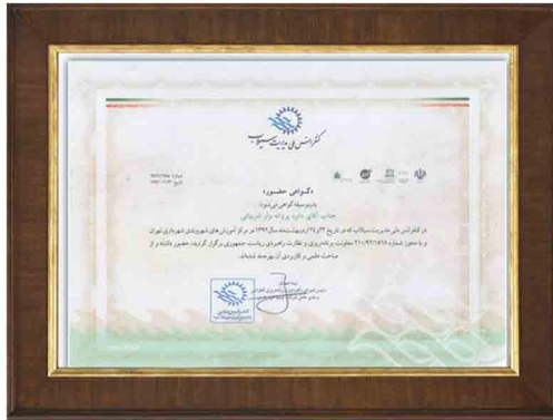
گواهی حضور در کنفرانس ملی مدیریت سیلاب در سال ۱۳۹۲