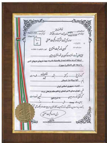
گواهینامه ثبت اختراع درجه های کوپلیمری