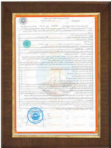
بیمه نامه تضمین کیفیت ، مسئولیت جانی و مالی از شرکت سهامی بیمه ایران