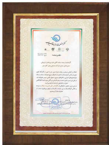
تقدیرنامه کنفرانس ملی مدیریت سیلاب