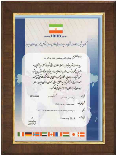
گواهینامه ثبت اطلاعات شغلی در سایت مشاغل جمهوری اسلامی ایران