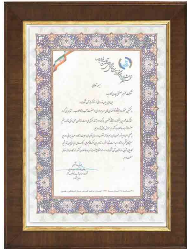
تقدیرنامه شرکت در نخستین نمایشگاه توانمندی های بهره برداری در صنعت آب و فاضلاب