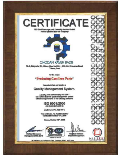
گواهینامه ایزو ۲۰۰۰ - ۹۰۰۱