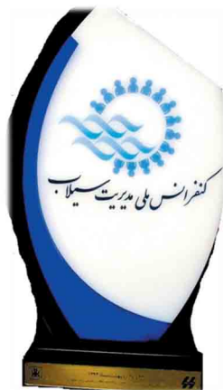
تندیس کنفرانس ملی مدیریت سیلاب