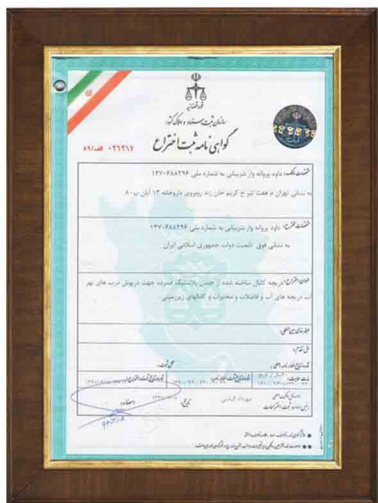
گواهینامه ثبت اختراع درجه های کوپلیمری