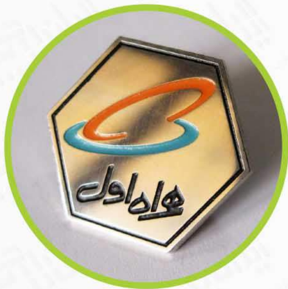
بیج های رنگی