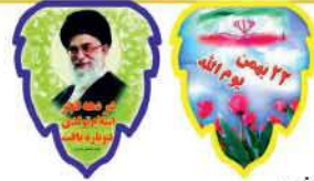
ریشه برگی دهه فجر