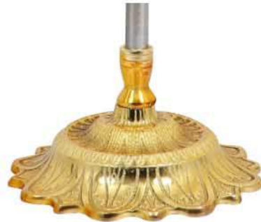
پایه خورشیدی طلایی نوع یک