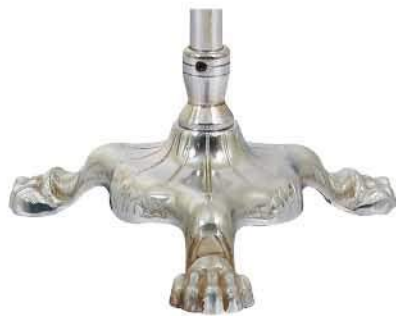
پایه پنجه شیری نقره‌ای