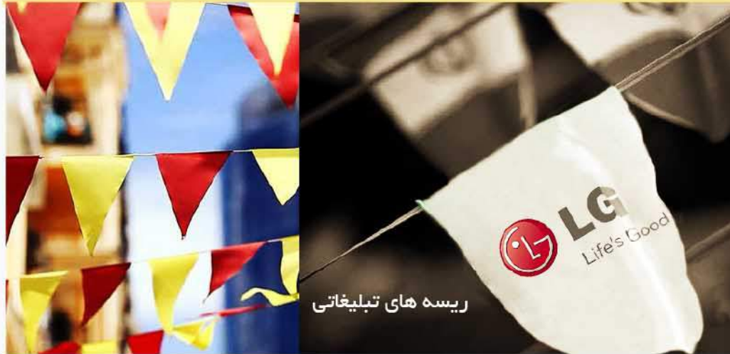
ریسه های تبلیغاتی