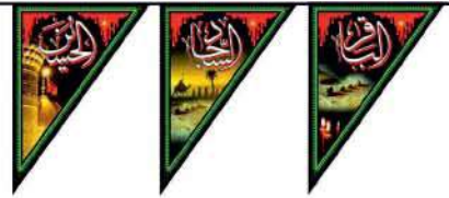
ریشه چهارده معصوم