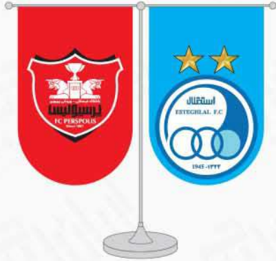
پرچم رومیزی ساتن