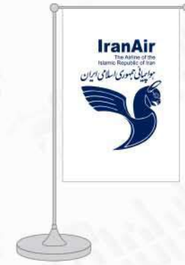
پرچم رومیزی ساتن