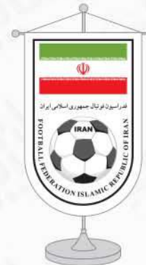
پرچم رومیزی ساتن