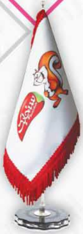
ساتن آمريکائی چاپ ديڄيٽال