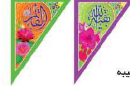
ریشه مثلث طرح کتیبه