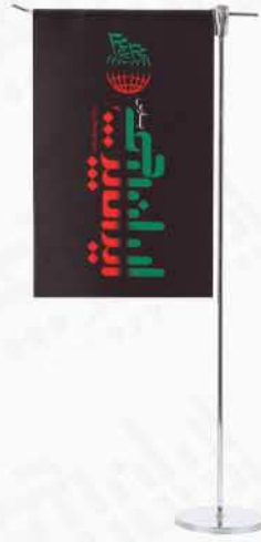
پرچم رومیزی ال