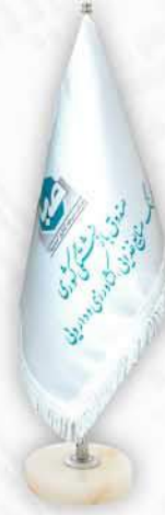
ساتن آمريکائی چاپ سيلک