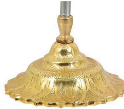
پایه خورشیدی کله قندی