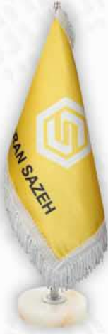
ساتن ژاپنی چاپ سيلک