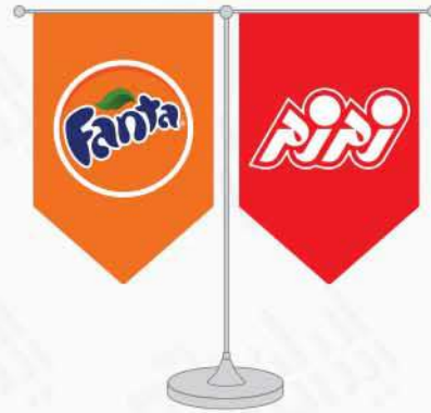
پرچم رومیزی ساتن