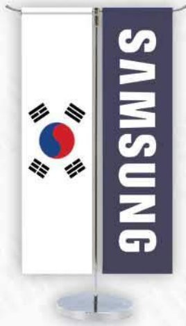
پرچم رومیزی تی