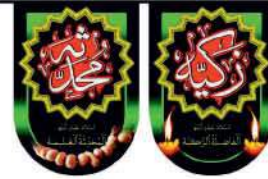
ریشه لبگرد اسما: حضرت فاطمه