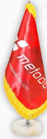
ساتن براق چاپ سيلک