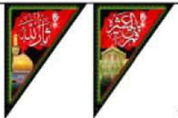
۲ برگ درهر ریشه به طول تقریبی ۸ متر