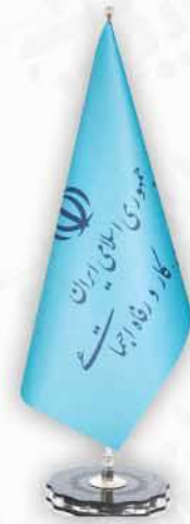
پرچم رومیزی مخروطی (جدید)