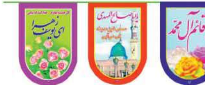
ریشه نیمه شعبان