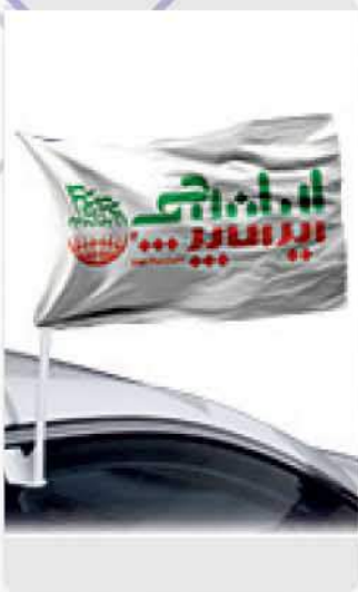
پایه پرچم ماشینی