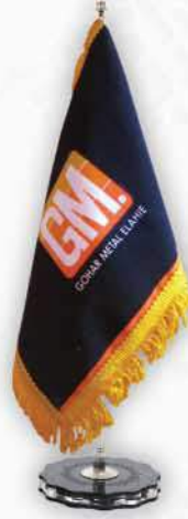
حير چاپ سيلک