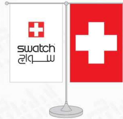
پرچم رومیزی ساتن