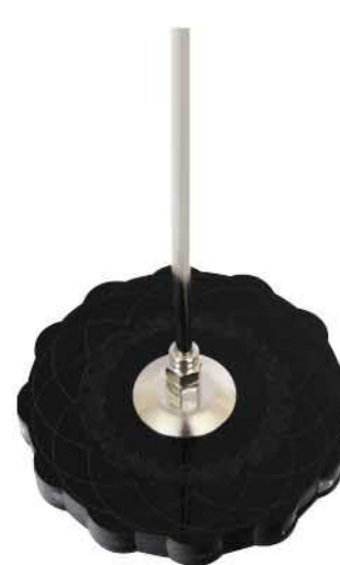
پایه پلکسی مشکی