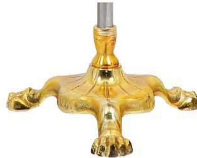
پایه پنجه شیری طلایی نوع یک