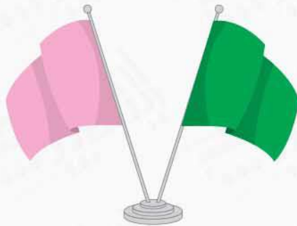
پرچم رومیزی ساتن