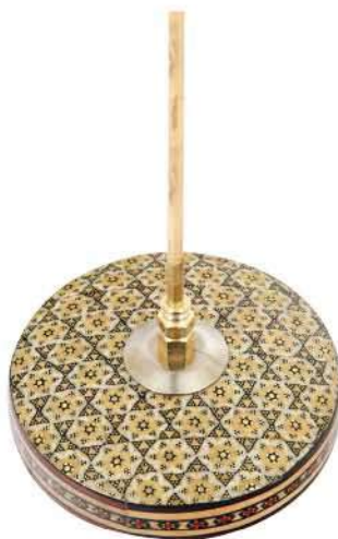
پایه خاتم گرد