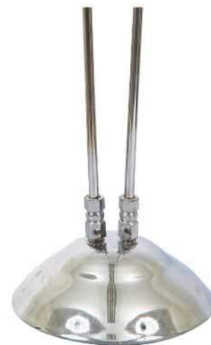
پایه استیل دوميله