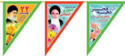
ریشه دهه فجر