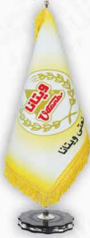
حير چاپ سيلک