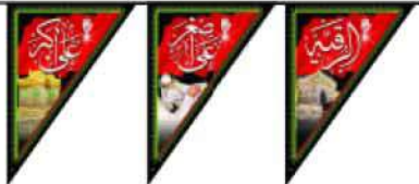
ریشه لبگرد طرح محرم