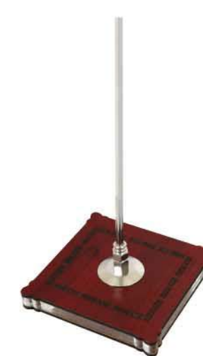
پایه چوبی رومیزی