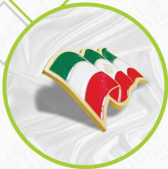
بیج یا پوشش اپوکسی