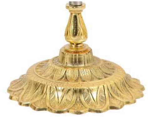
پایه خورشیدی ممتاز