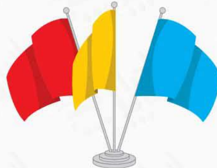
پرچم رومیزی ساتن