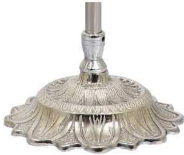
پایه خورشیدی نقره‌ای