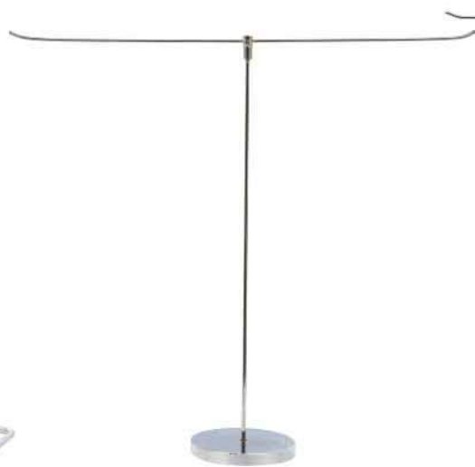
پایه استیل تی