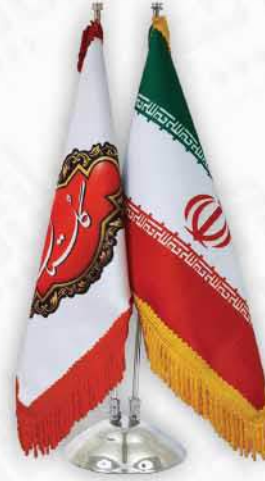
پرچم رومیزی دوميله