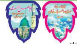
ریشه برگی نیمه شعبان