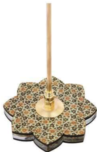
پایه خاتم گل