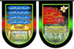
۲ برگ درهر ریشه به طول تقریبی ۸ متر