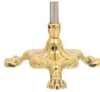
پایه پنجه شیری طلایی نوع دو