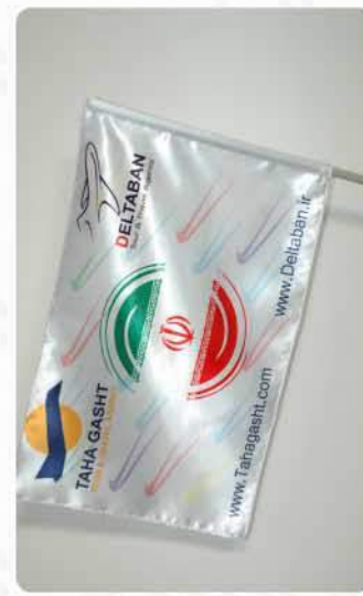
پرچم دستی تبلیغاتی