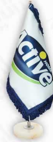
ساتن چاپ ديڄيٽال