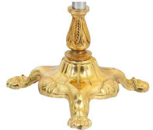
پایه پنجه شیری ممتاز