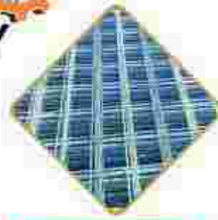
مش سبک و سنگین