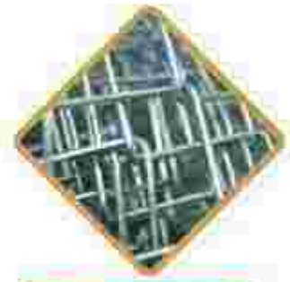
توری سرنده رولی