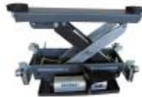
جک چرخ آزادکن (۲/۶ تن)